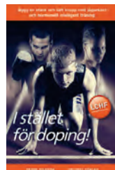
I stället för doping! ISBN 978-91-7241-175-3