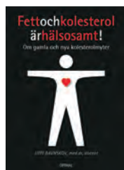
Fett och kolesterol är hälsosamt! ISBN 978-91-7241-146-5