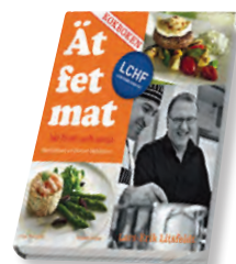
Ät fet mat! - bli frisk och smal med LCHF - KOKBOKEN ISBN 978-91-7241-177-7