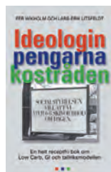
Ideologin och pengarna bakom kostråden ISBN 978-91-7241-142-5