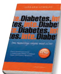
Diabetes. Inte. - Den naturliga vägen med LCHF ISBN 978-91-7241-169-2